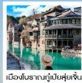
เมืองโบราณกู่เป่ย์ส่วยเจิน