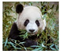
ศูนย์หมีแพนด้าตูเจียงเยียน