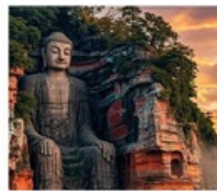
หลวงพ่อโตเล่าซาน