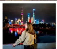
เชียงใหม่คลาสสิกไนท์