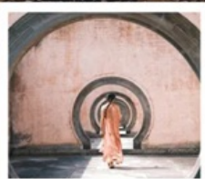
หมู่บ้านโบราณเจียงชาน