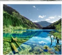
จั๋วจ้ายโกว

จาก 8 ชม. เหลือ 2 ชม. เร็วทันใจด้วยรถไฟความเร็วสูง เฉิงตู - จั๋วจ้ายโกว