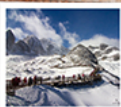
ภูเขาหินมังกรหยก

ลัดยี่ซานดง / ไร่ตราบเม้าเยงซี / เมืองโบราณเซงกีสล่า / วัดลามซงจันหนิง / ช่องเทมเส็งกรโอด เมืองโบราณรุ่งทอ / ภูเขาหินมังกรหยก / ภูเขาพระเจดีย์สีน้ำเงิน / ไร่จางอวี่ใหม่ สะพานมังกรดำ / สวนแก้วลี่เจียง / เมืองโบราณลี่เจียง ต้าหมิงทง / วัดหยวนทง