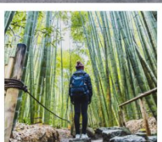
วัดโฮคะคุจิ