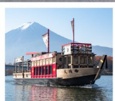
ค่องเรืออาปาเระ