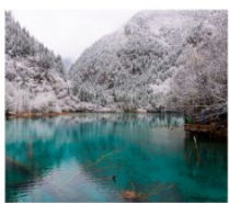
จี๋จ้ายโกว