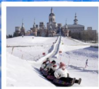
คฤหาสน์วอลการ์