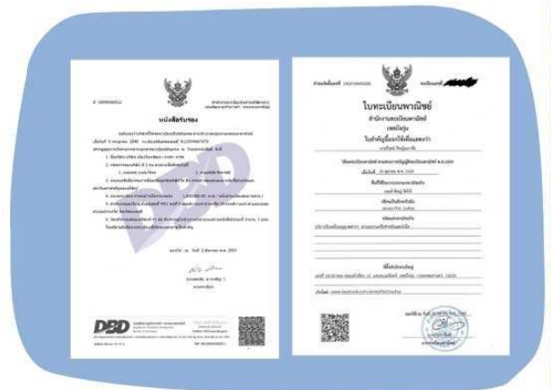
ตัวอย่างหนังสือจดทะเบียนบริษัท และ ใบทะเบียนพาณิชย์