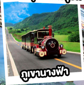
ภูเขาฉางฟ้า