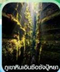
ภูเขาหินเอนซือชังปู้หย่า