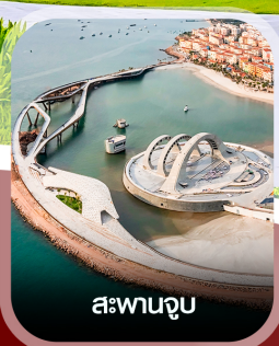
สะพานจูป