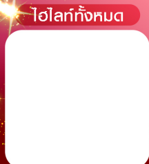
ไฮไลท์ทั้งหมด