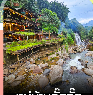
หมู่บ้านก๊วกก๊วก