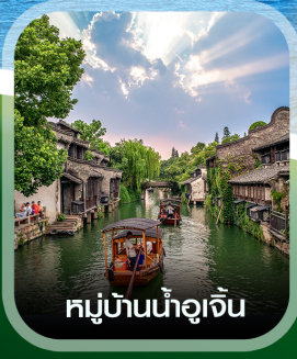
หมู่บ้านน้ำอู๋เจิน