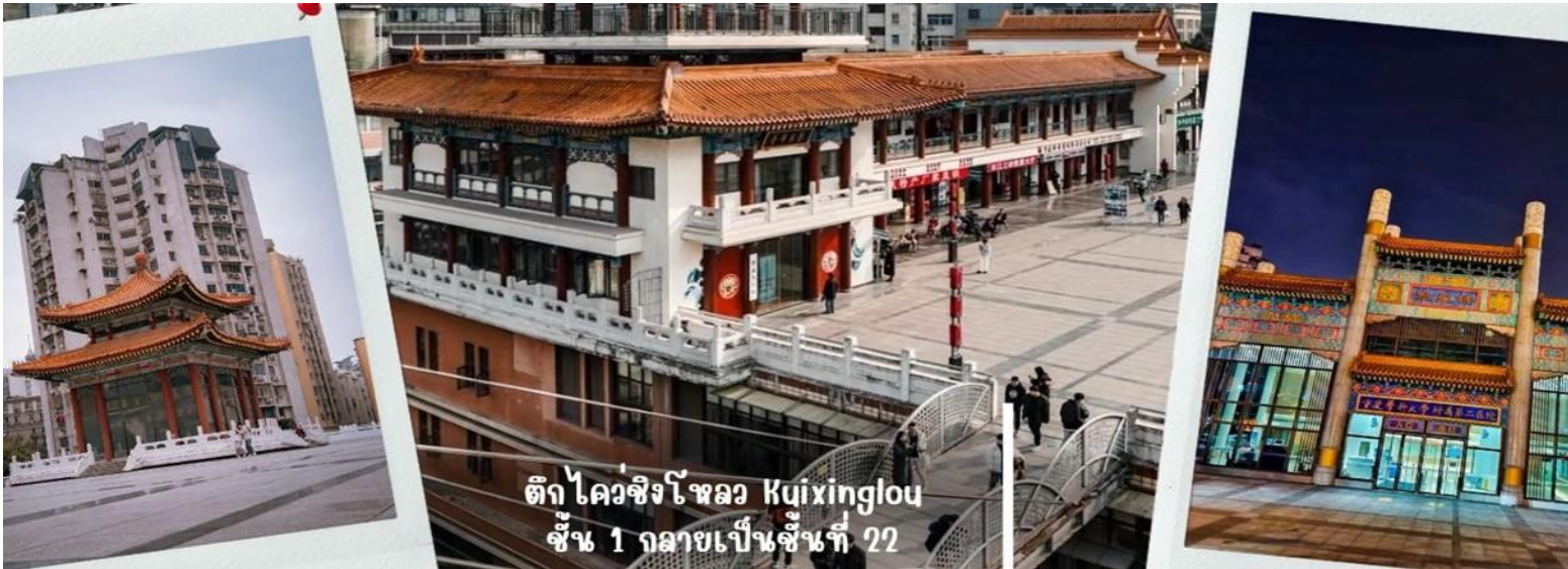
ตึก ไควชิงโหลว Kuixinglou ชั้น 1 กลายเป็นชั้นที่ 22

นำท่านเดินทางไปชมความแปลกใหม่ที่ ตึกไควชิงโหลว (ตึก 22 ชั้น) Kuixinglou ชั้น 1 กลายเป็นชั้นที่ 22 ของอีกฝั่ง อาคารเก่าแก่ดั้งเดิมหัตถ์จรรยา ยังเป็นสถานที่ถ่ายทำภาพยนตร์เรื่อง "Young You" โดย Yi Yang Qianxi "Kui Xing Tower" อาคารโบราณที่ตั้งอยู่ในเมือง ที่นี่ได้รับการต่อเติมและสร้างขึ้นใหม่ในปี 1991 สิ่งมหัศจรรย์ที่สุดที่นี่ไม่ใช่ตัวอาคาร แต่เป็นสะพานแขวนสองแห่งระหว่างจัตุรัสกับอาคารสำนักงาน สะพานแขวนที่เต็มไปด้วยรถกลมเชื่อมระหว่างชั้น 1 ของจัตุรัสกับชั้นบนสุดของชั้น 22 ฝั่งตรงข้ามมองลงมาจากชั้น 1 จะเห็นได้ว่าด้านล่างมี 22 ชั้น เป็นอาคารที่มีลักษณะพิเศษที่เมืองฉงชิ่ง ประเทศจีน เนื่องจากภูมิประเทศที่เป็นภูเขา อาคารแห่งนี้จึงมีทางเข้าในระดับที่ต่างกัน เป็นจุดถ่ายรูปและชมวิวที่โดดเด่นของเมืองฉงชิ่งที่ได้ชื่อว่าเป็น "เมืองสามมิติ"