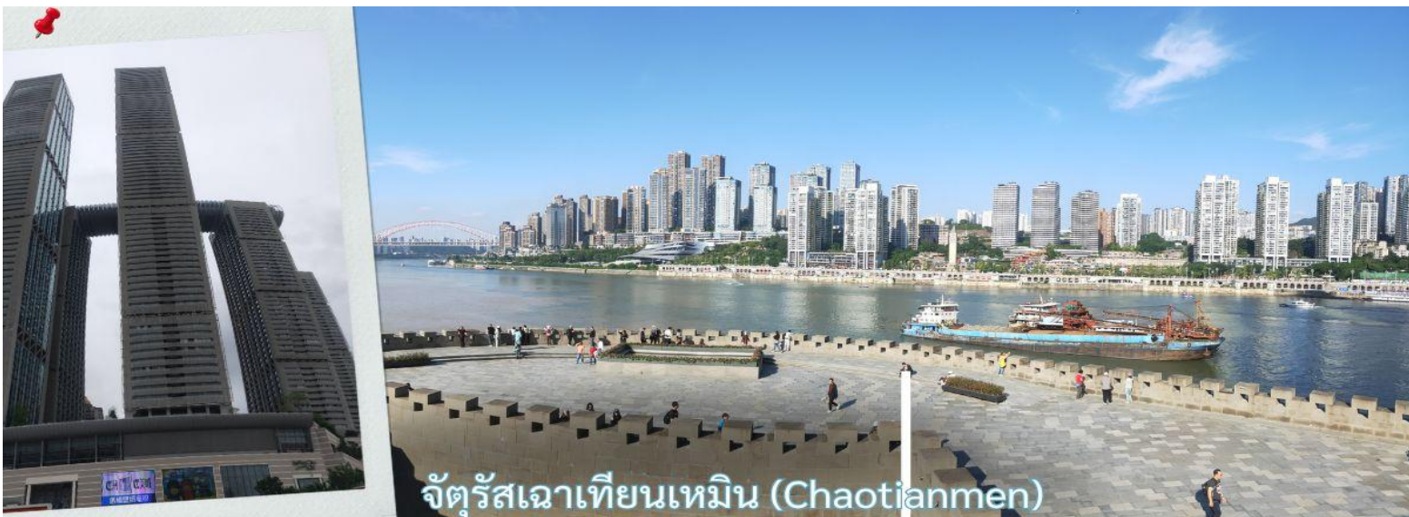
จัตุรัสเฉาเทียนเหมิน (Chaotianmen)

จากนั้น นำท่านเดินทางสู่ จัตุรัสเฉาเทียนเหมิน ซึ่งตั้งอยู่ ณ จุดบรรจบของ แม่น้ำแยงซี และ แม่น้ำเจียหลิง นับเป็นท่าเรือขนส่งทางน้ำที่ใหญ่ที่สุดของนครฉงชิ่ง และเป็นศูนย์กลางการค้าสำคัญมาอย่างยาวนาน บริเวณนี้ยังเป็นที่ตั้งของ ตลาดการค้าครบวงจรเฉาเทียนเหมิน ซึ่งถือเป็นตลาดขนาดใหญ่ที่สุดของฉงชิ่ง ทำให้พื้นที่โดยรอบเต็มไปด้วยผู้คนและมีชีวิตชีวาอยู่เสมอ ตั้งแต่อดีตจนถึงปัจจุบัน จัตุรัสแห่งนี้ได้รับการออกแบบให้มีลักษณะคล้ายเรือยักษ์ที่กำลังแล่นออกสู่สายน้ำอย่างสง่างาม จึงได้รับสมญานามว่า “โททานิคแห่งฉงชิ่ง” เมื่อยืนอยู่บนจัตุรัส ท่านจะสามารถมองเห็นภาพอันน่าประทับใจของจุดบรรจบระหว่างแม่น้ำสองสาย โดยน้ำสีเหลืองของแม่น้ำแยงซีและน้ำสีเขียวมรกตของแม่น้ำเจียหลิงไหลมาบรรจบกันอย่างชัดเจน สร้างทัศนียภาพที่สวยงามและเป็นเอกลักษณ์ของฉงชิ่งอย่างแท้จริง