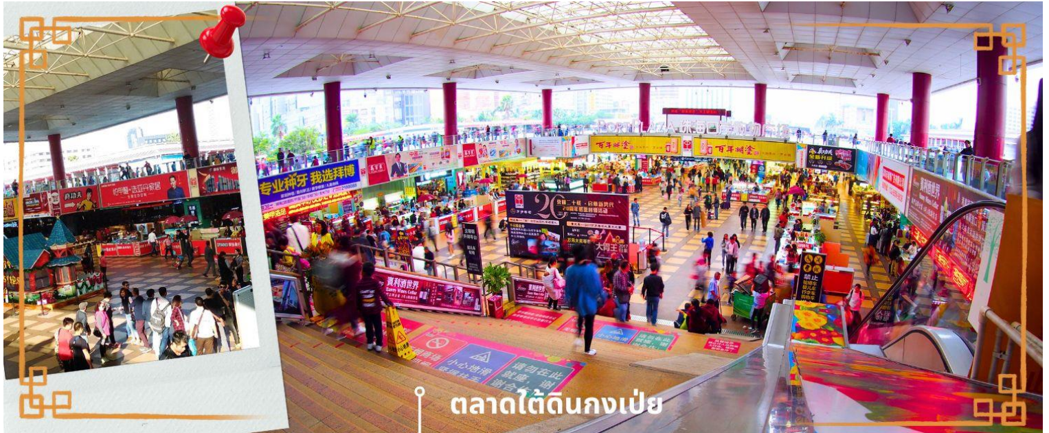
ตลาดใต้ดินกงเป๋ย

จากนั้นนำท่าน อิสระช้อปปิ้งตลาดใต้ดินกงเป๋ย ตั้งอยู่ติดชายแดนมาเก๊า เป็นศูนย์การค้าติดแอร์ ที่มีร้านค้ามากกว่า 5,000 ร้านค้า มีสินค้าให้ท่านเลือกมากมาย เช่น สินค้าก๊อปปี้แบรนด์เนมต่างๆ ไม่ว่าจะเป็นเสื้อผ้า รองเท้า กระเป๋า นาฬิกา ของเด็กเล่น ฯลฯ ที่นี่ มีสินค้าให้เลือกซื้อหลากหลาย จึงเป็นที่นิยมมากของชาวมาเก๊า และฮ่องกง เนื่องจากสินค้าที่นี่มีคุณภาพและราคาถูก