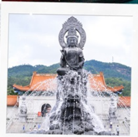
วัดพุทโธ