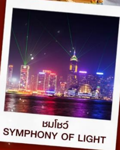
ชมโชว์ SYMPHONY OF LIGHT