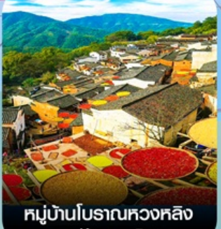
หมู่บ้านโบราณหวงหลิง (หมู่บ้านตากพรึก)