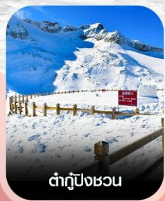
ตำกู่ปิงชวอน

✈️ คอนเฟิร์มออกเดินทาง ทุกพีเรียด 2 ท่านขึ้นไป ✈️