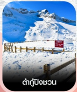
ต้ากู่ปิงชอน