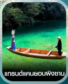
แกรนด์แคนยอนผิงชาน