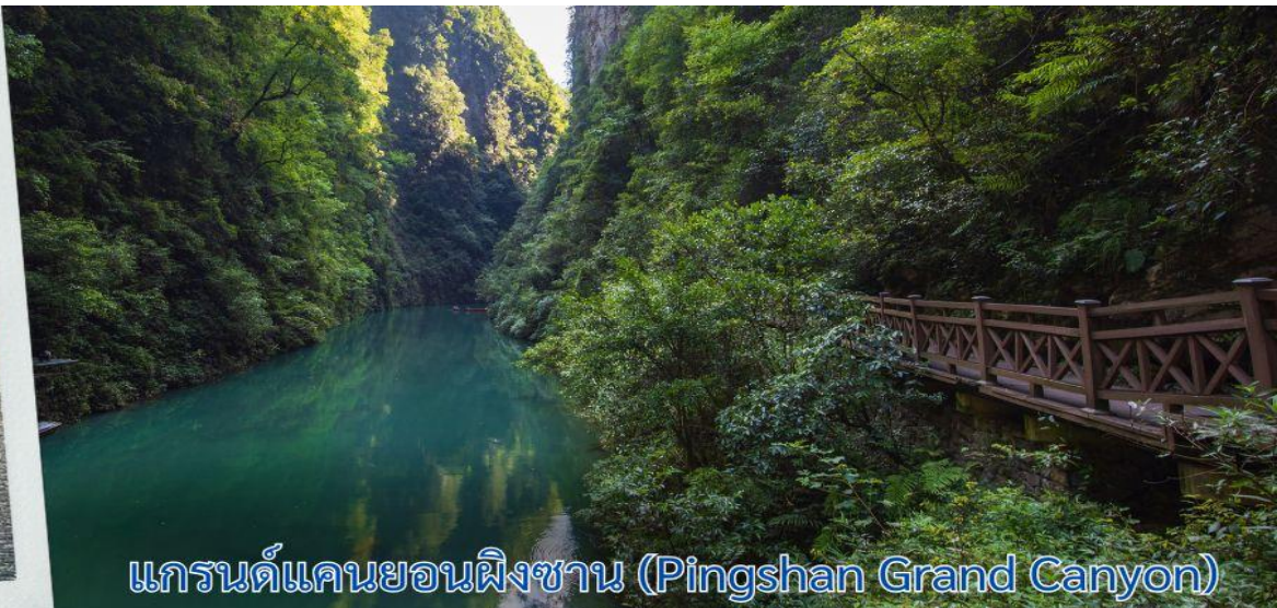
แกรนด์แคนยอนผิงซาน (Pingshan Grand Canyon)

เที่ยง รับประทานอาหารกลางวัน ณ ภัตตาคาร (6)