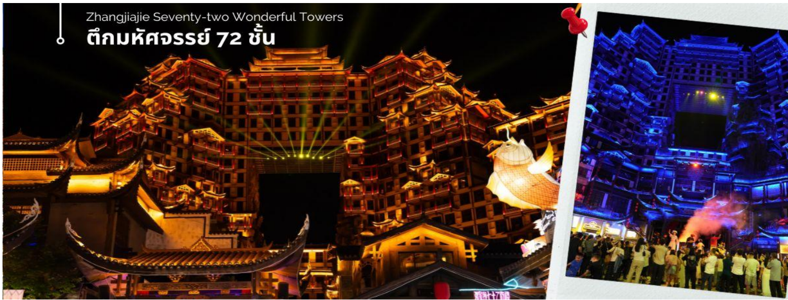
Zhangjiajie Seventy-two Wonderful Towers ตึกมหัศจรรย์ 72 ชั้น

จากนั้นนำทุกท่าน ชมวิวตึกมหัศจรรย์ 72 ชั้น จุดเช็คอินใหม่ล่าสุดของเมืองจางเจียเจี๋ย โดยการสร้างตึกในครั้งนี้เป็นการรวมเอาจุดเด่นของเมืองจางเจียเจี๋ยกับวัฒนธรรมการสร้างบ้านเรือนของชาวพื้นเมืองถู่เจียมารวมกันโดยอาคารสูงที่สร้างจำลอง เขาเทียนเหมินซานหรือประตูสวรรค์ และ บ้านยกพื้นโบราณที่เป็นบ้านพื้นเมืองของชาวถู่เจีย ภายในบริเวณตึก 72 ชั้น ยังรวบรวม รีสอร์ท ร้านอาหาร สตรีทฟู้ด ร้านขายของที่ระลึก ที่ตกแต่งด้วยแสงสีสุดอลังการ ตั้งอยู่ใจกลางเมืองจางเจียเจี๋ย