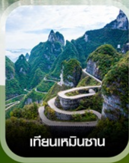
เกียนเหมินซาน

✈️ คอนเฟิร์ม ออกเดินทาง ทุกพีเรียด 2 ท่านขึ้นไป