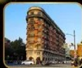
ตึกยุโรปชื่อดัง WUKANG MANSION