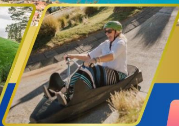
เล่นลู่ ที่ควีนส์ทาวน์

บินภายใน (เที่ยวสุดคุ้ม) พักโรงแรม 4 ดาว ★★★★★