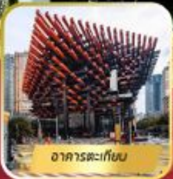
อาคารตะเกียบ