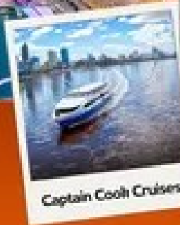
Captain Cook Cruises