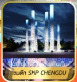
สวนตึก SKP CHENGDU