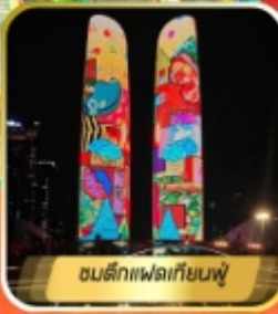
สวนตึกแฟลตเทียนฟู่