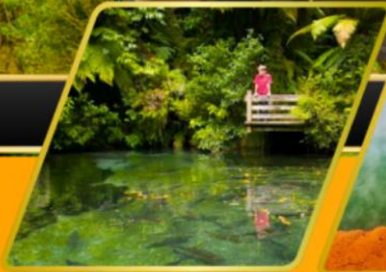
พาราไดซ์ สปริงส์ วอเตอร์เฟลล์