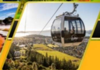
นั่งกระเช้า gondolá เมืองโรโตรัว