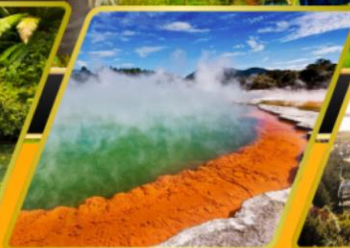
น้ำพุร้อน WAI-O-TAPU