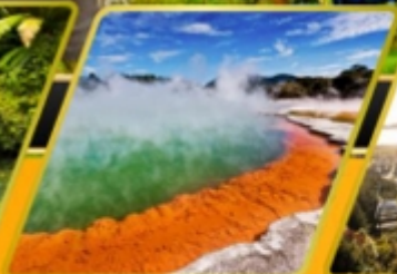
น้ำพุร้อน WAI-O-TAPU