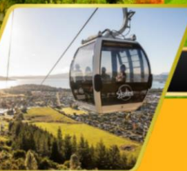
นั่งกระเช้าคอนโดล่าเมืองโรโตรัว