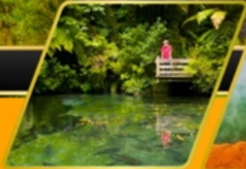
พาราไดซ์ สปริงส์ วิลเลจ