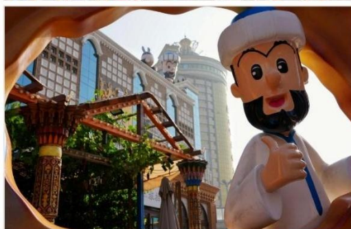
ตลาดนานาชาติซินเจียงแกรนด์บาร์ซาร์