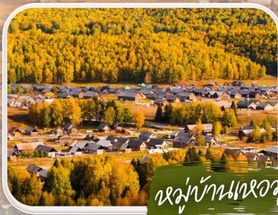
หมู่บ้านเหมอู่