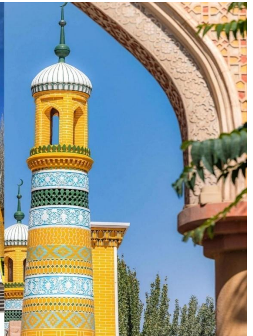
มัสยิดอิคกาห์ (Id Kah Mosque)