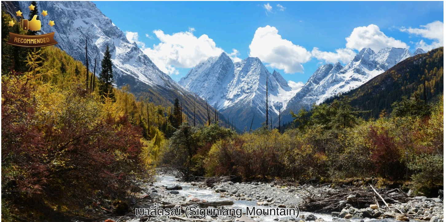
เขาสีดาร์ณี (Siguniang Mountain)

ห้อง ตามตำนานเล่าว่าเป็นยอดเขาที่สูงที่สุดคือน้องสาวคนสุดท้ายเพราะตามธรรมเนียมท้องถิ่น น้องจะมีความเป็นอยู่สบายที่สุด ร่างกายจึงเจริญเติบโตได้ดีที่สุด ส่วนพี่นั้นต้องทำงานช่วยพ่อแม่ เลี้ยงน้อง ร่างกายจึงเจริญเติบโตได้ไม่เต็มที่ ทำให้กลายเป็นภูเขามีสเกลเล็กที่สุดนั่นเอง