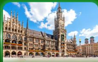
จัตุรัสมาเรียนพลัทซ์ มิวนิก