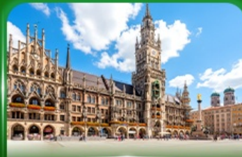
จัตุรัสมาเรียนพลัทซ์ มิวนิก