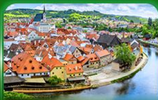
เมืองมรดกโลก เซสท์ครุมลอฟ