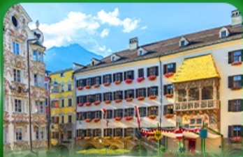
หลังคาทองคำ อินส์บรุค