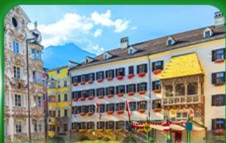
หลังคาทองคำ อินส์บรุค