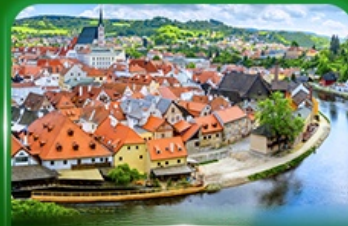
เมืองมรดกโลก เซสที่ครุมลอฟ