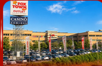
ฟ็อกซ์ทาวน์ เฉาก์เล็ก