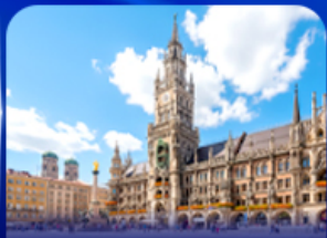
จัตุรัสมาเรียนพลัทซ์ มิวนิก