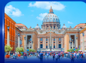
นครรัฐวาติกัน โรม