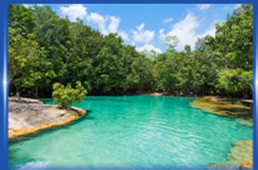
สระมรกต กระบี่