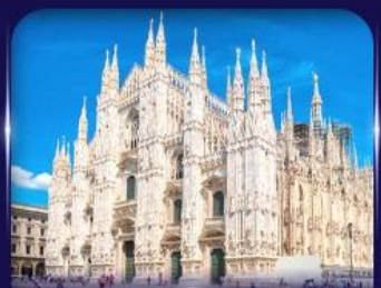
เซ็คอินวิหารดูโอโม มิลาโน