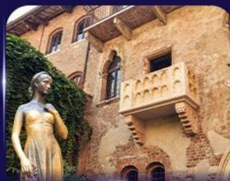
เขื่อนบ้านจูเลียต เวิร์นา