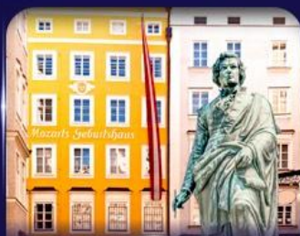
บ้านเกิดโมสาร์ท ซาลซ์บูร์ก