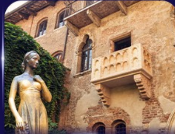
เยือนบ้านจูเลียต เวโรนา