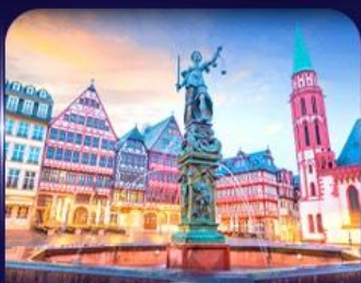
จัตุรัสโรเมอร์ แพรงก์เฟิร์ต