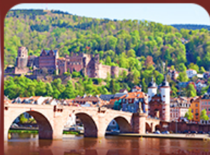
ชมเมืองสวย ไฮเดลเบิร์ก