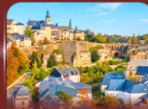
ย่านเมืองเก่า ลักเซมเบิร์ก