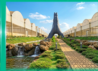
Agro Vege Farm