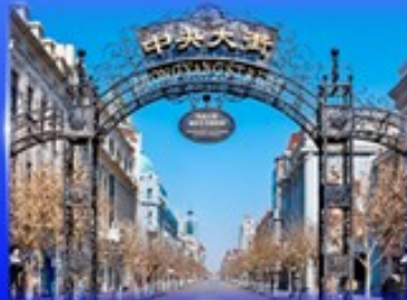
ย่านจงหยาง สตรีท