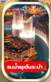
ชมน้ำพุเต้นระบำ

นั่งรถ 4WD ชมทะเลทรายอาหรับ พร้อมทานดินเนอร์อาราเบีย