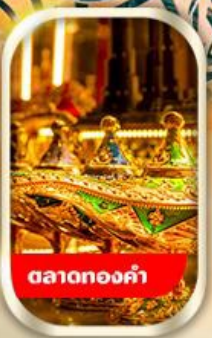
ตลาดทองคำ