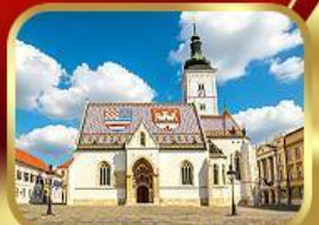
โบสถ์เซนต์มาร์ก ซาเกรบ