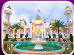
ชมมัสยิดกลางปัตตานี