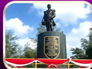
อนุสาวรีย์กรมหลวงชุมพรฯ