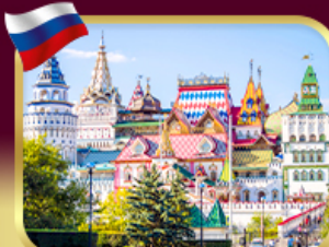
อิสมาลอฟสกีมาร์เก็ต