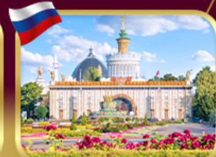
สวนสาธารณะ VDNKH