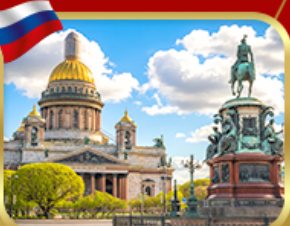
มหาวิทยาลัยเซนต์ไอแซค