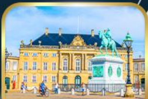
พระราชวังอมาเลียนบอร์ก

ล่องเรือสำราญ DFDS • ลิตเติลเมอร์เมด • พระราชวังคริสเตียนบอร์ก • มหาวิทยาลัยออสโล • อนุสาวรีย์คาร์ลสตัด • ถนนคนเดินดรอคนิงกาดัน • ย่านบูฮาวน์ • ถนนสตโรยอร์ก