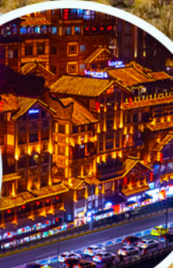
เซียงหยาดัง

**รวมค่าลิฟต์แก้ว รถอุทยาน รถแบริดเจอร์ี่เรียบร้อยแล้ว**