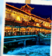
เขื่อนน้ำสีฟ้า

เที่ยวจีน 6 วัน 5 คืน 2 เมืองดัง ทัวร์ลงชิง เจิงตุ เฮาส์ดรุณี