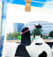
แพนด้าเซลฟี่