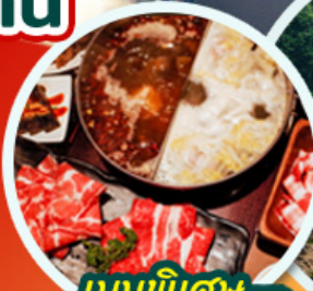
เมนูพิเศษ ชาบูหม่าล่า