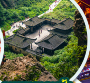
อุทยานหลุมฟ้า สะพานสวรรค์