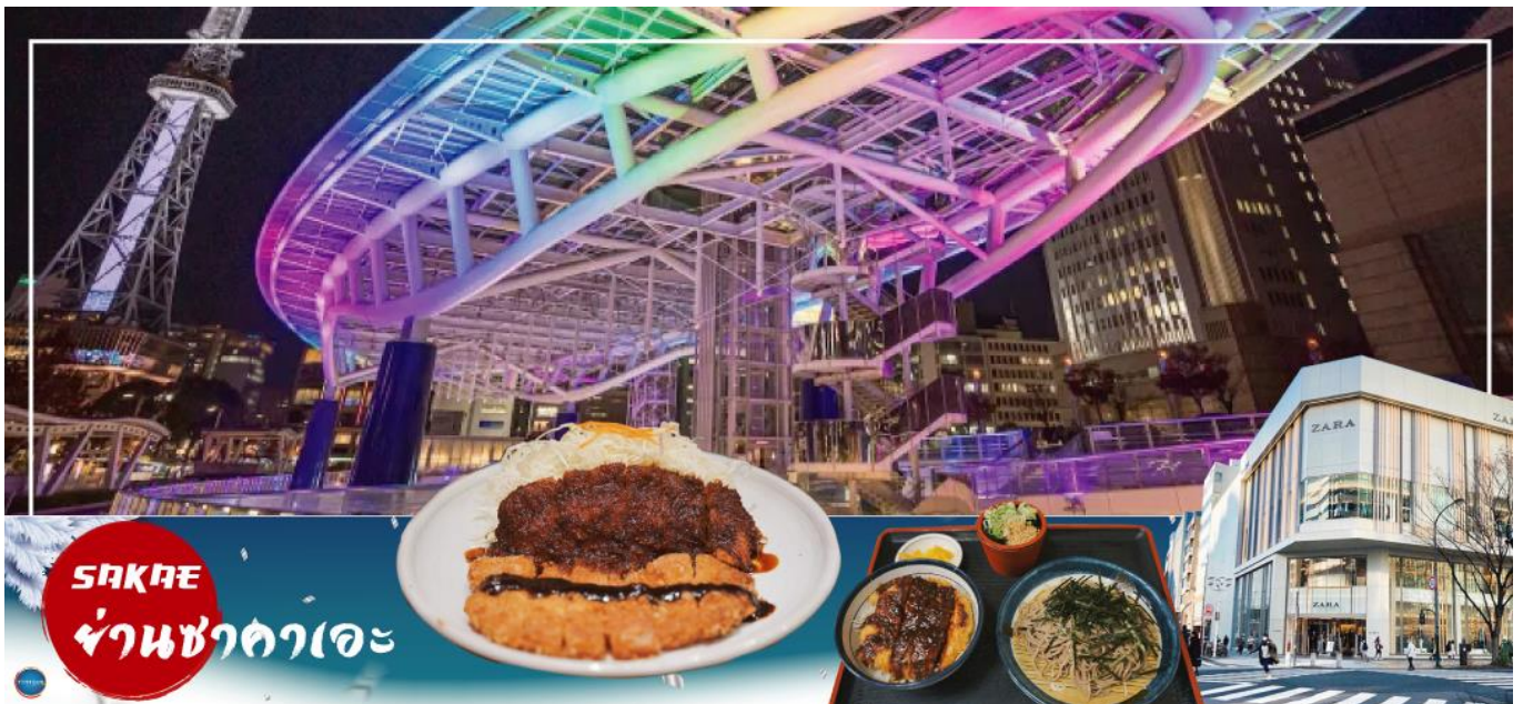
ค่า อีสระรับประทานอาหารค่ำตามอัธยาศัย

อีสระให้ท่านเดินเล่นช้อปปิ้ง ย่านซาคาเอะ (Sakae) เป็นย่านธุรกิจการค้า โดยเฉพาะแหล่งราตรี เช่น คลับและบาร์ มีห้างสรรพสินค้ามีดสีซาคายะ หรือ เมืองใต้ดิน (Central Park) แหล่งรวมแฟชั่นและร้านค้าสุดเก๋มากมาย เช่น ร้านเสื้อผ้า, ร้านของใช้กระจุกกระจิก, ร้านชาลอนความงาม เป็นต้น แฟชั่นไฮโดลญี่ปุ่น ห้ามพลาด ต้องมาเยือนห้างสรรพสินค้าชั้นไนซ์ ซาคาเอะ ซึ่งเป็นจุดศูนย์กลางแหล่งรวมความบันเทิงมากมาย ที่มี Grand Canyon ฮอลล์จัดคอนเสิร์ตศิลปินไฮโดลและยังเป็นคาเฟ่ นอกจากนี้ที่นี่ยังเป็นสถานที่ตั้งของ "ชิงช้าสวรรค์ Sky Boat" แลนด์มาร์คของย่านนี้อีกด้วย อีสระเพลิดเพลินย่านนี้ตามอัธยาศัย