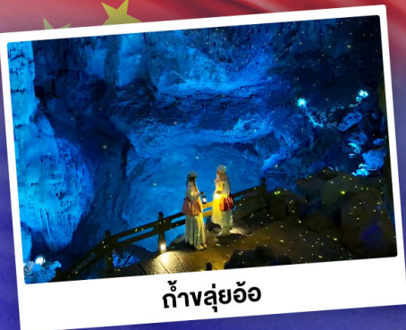
ถ้ำลู่อ้อ

"ดินแดนแห่งสาขน้ำและภูเขา" สัมผัสประสบการณ์นั่งบอลลูนชมวิวมุมสูง