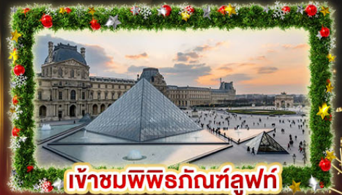
เข้าชมพีระมิดที่ลูฟร์