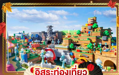
อิสระท่องเที่ยว